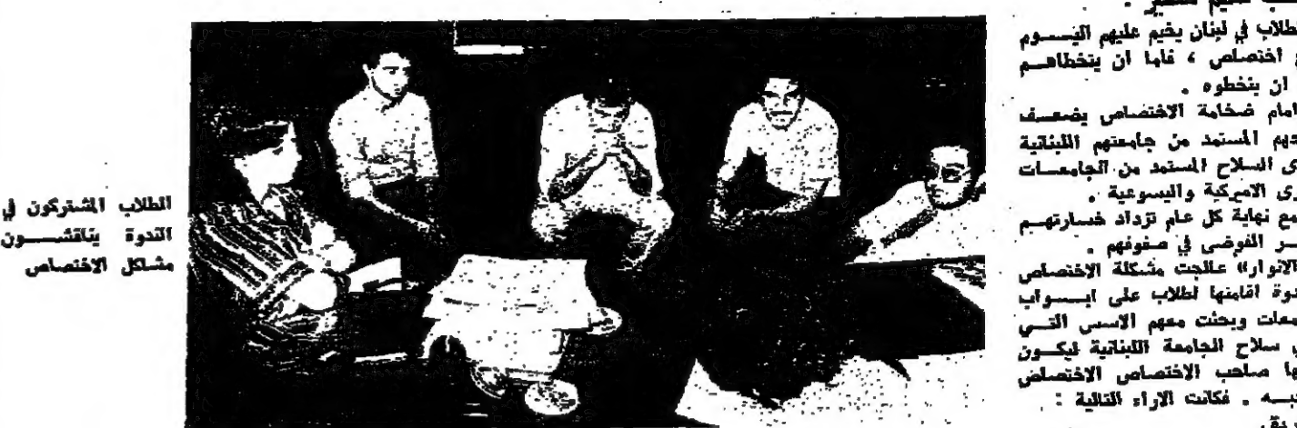
الطلاب المشركون في نقاشات حول سوق البطالة